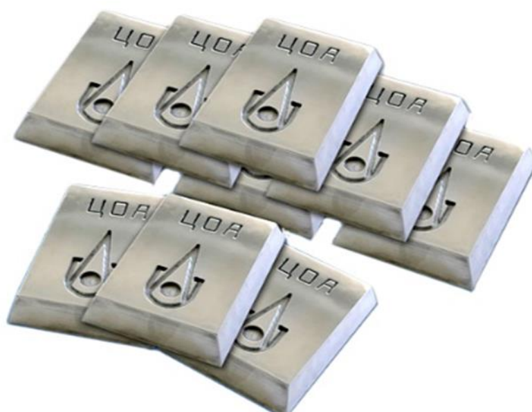
1-rasm. Rux metallining ko‘rinishi

1) xom ashyoda mavjud bo‘lgan bir qator ruxga yo‘ldosh elementlarni ajratib